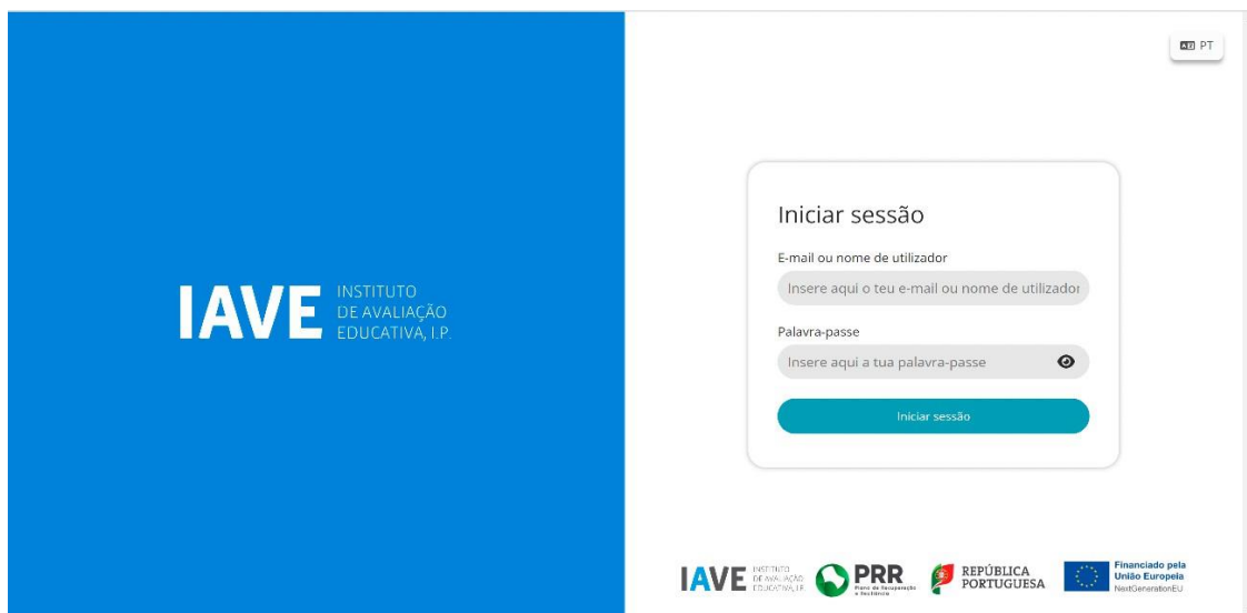
Figura 1 – Acesso à Plataforma de Realização de Provas do IAVE