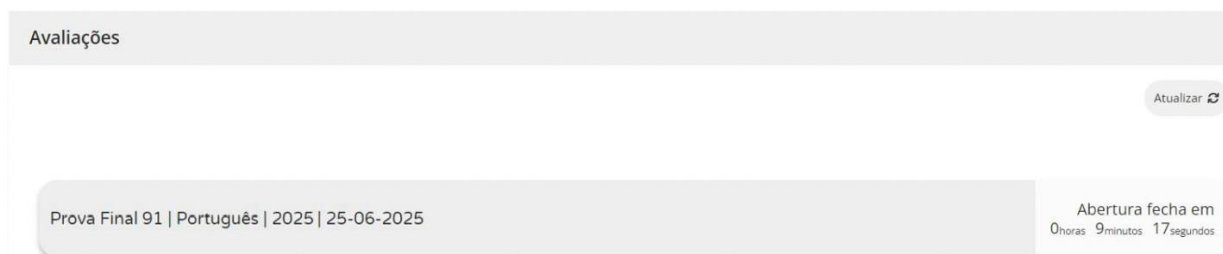
Figura 2 – Acesso à prova a realizar

12.8. Nas provas, ao clicar em “Iniciar sessão”, por exemplo, para um aluno que realiza a prova final de Português (91), aparece o seguinte ecrã: